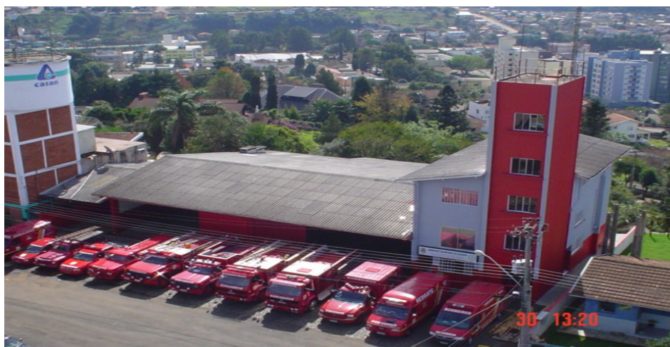
Foto: Sede da Regional no Município de Caçador