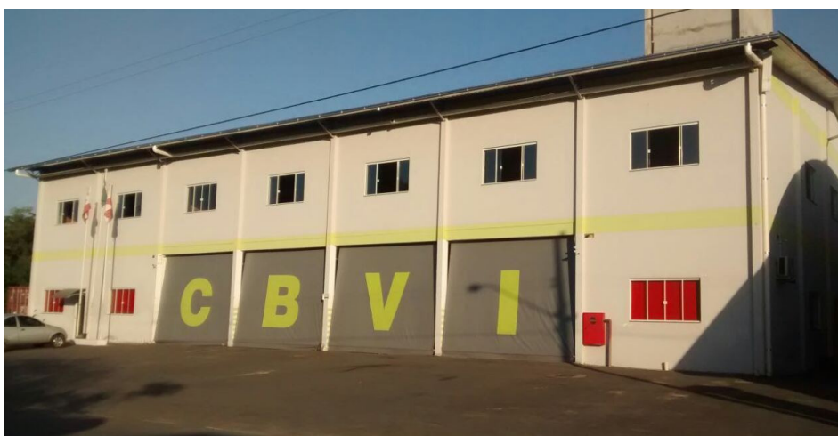
Foto: Sede da Regional no Município de Indaial