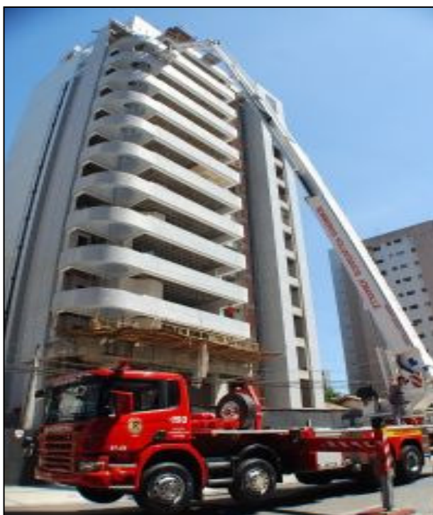
Fotos: Ilustração da Plataforma de 54 metros