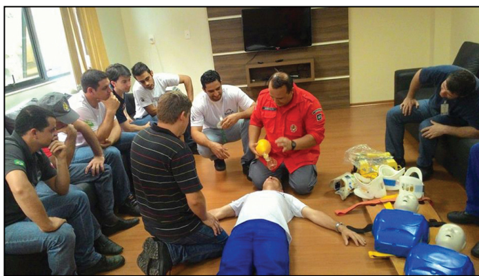
Fotos: Capacitações nas comunidades.