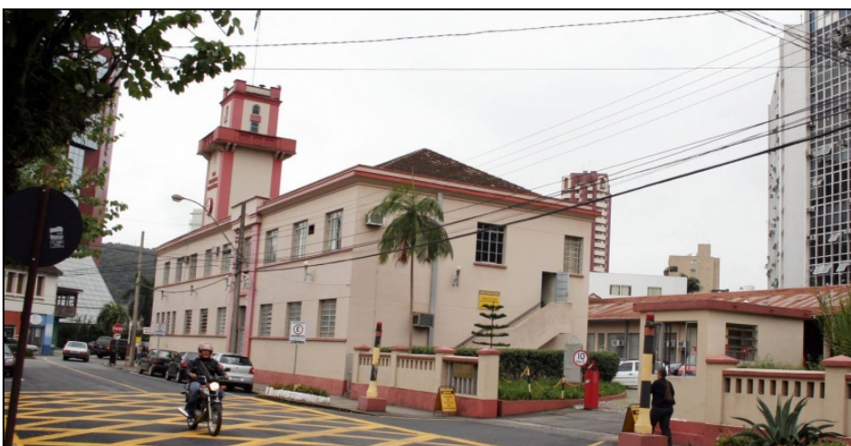
Foto: Sede da Regional no Município de Joinville