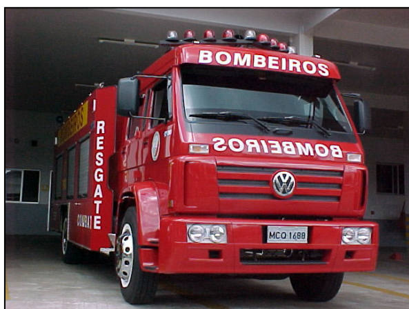
Foto: Ilustra modelo de caminhão de Combate Foto: Ilustra modelo de Ambulância

As unidades filiadas possuem juntas 396 unidades móveis de atendimento. Este número é composto por carros de combate a incêndio modelo bomba/tanque, caminhões tanque, carretas, ambulâncias para suporte básico, veículos especiais para salvamentos terrestres e aquáticos, escadas mecânicas do tipo Magirus, plataformas elevatórias, com destaque para a unidade com alcance de até 54 metros de altura, caracterizando-se como a única da região sul do Brasil com essa possibilidade, além de veículos para apoio administrativo e motocicletas.