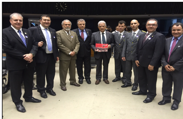
lançamento da Frente Parlamentar Mista