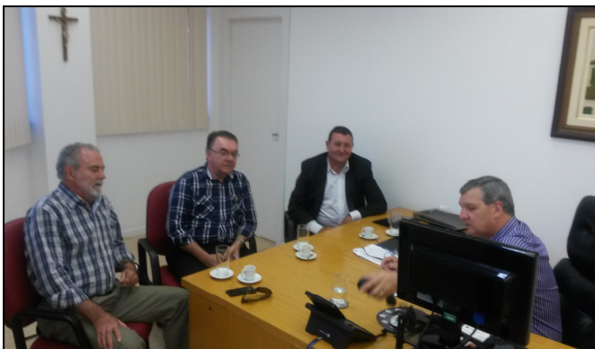
Foto: Ação junto Secretário do Fundo Social para o Convênio 2015/2016

Na esfera Federal destaca-se a criação da Frente Parlamentar Mista em Defesa dos Bombeiros Voluntários , pela Câmara Federal e o Senado, que dentre as premissas atuarão em “ Defesa, capacitação e incentivo a essa atividade voluntária ”.