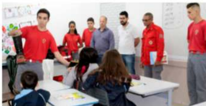
Bombeiros mirins e aspirantes de Joinville (acima) no projeto Escola Cidadã; à dir., instrução para os bombeiros mirins e aspirante de Navegantes

→ Educação e treinamento por meio de palestras e cursos diretamente nas comunidades onde os bombeiros voluntários estão inseridos. A atuação ocorre nas escolas, associações de moradores e classe, nas empresas ou em parcerias com órgãos e secretarias do poder público em projetos específicos (Escola Cidadã, Bombeiro na Escola, prevenção a acidentes aquáticos, entre outros). As palestras e capacitações nas comunidades somaram 9.666 atividades nos 12 meses do ano.